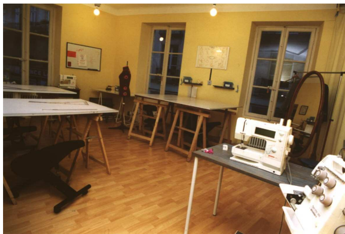
Une salle de cours d'A&A PATRONS